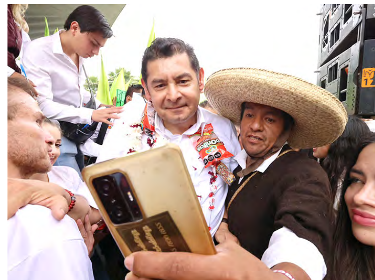
Claudia Aguilar Fotos X

El plan surgió en el 2016 durante el sexenio de Rafael Moreno Valle Rosas, pero que no generó ingresos para mantenerse, lo cual orilló a sacarlo de servicio desde enero de 2022.