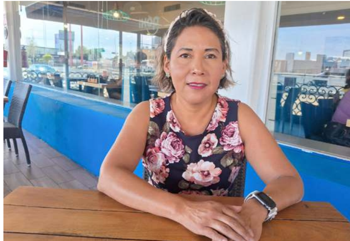
Francisco Sánchez Nolasco Fotos Cortesía

En ocasiones la gente busca sólo quejarse, sin hacer ni participar, dijo la candidata a jueza y señaló que estará en el número tres de la boleta amarilla del Distrito I del Sexto Circuito, que comprende la parte centro norte del estado.