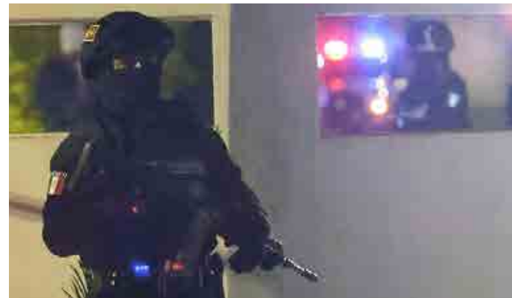
Garantizar la paz, le pide a AMLO

Al hacer un llamado al Presidente de la República, Andrés Manuel López Obrador y al gobernador, Sergio Salomón Céspedes Peregrina para que cumplan con su obligación constitucional de garantizar la paz y las condiciones elementales para el desarrollo de un proceso electoral democrático, el candidato a gobernador de un Mejor Rumbo para Puebla, advirtió que "fue un atentado en su contra", luego de la irrupción en el fraccionamiento, en Zavaleta, donde vive. "Hago un energético llamado al Presidente de la República, Andrés Manuel López Obrador y al gobernador del estado, Sergio Salomón Céspedes Peregrina para que cumplan con su obligación constitucional de garantizar la paz y las condicio-