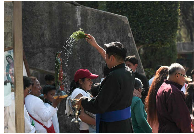
José Antonio Machado Fotos Es Imagen

La edición 2024 de la Feria Guadalupana se desarrollará hasta el jueves 12 de este diciembre en el Seminario Mayor Palafoxiano. La tradicional celebración de las mañanitas en el Santuario Guadalupano del Seminario se realizará 15 minutos previos a la media noche del miércoles 11.