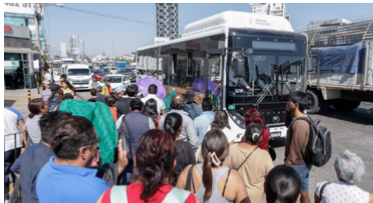
Claudia Aguilar

Estiman que en 10 días más podría iniciarse el cobro del servicio. Ante la falta de un elevador, para los paraderos, se sancionará a la empresa Traffic Light.