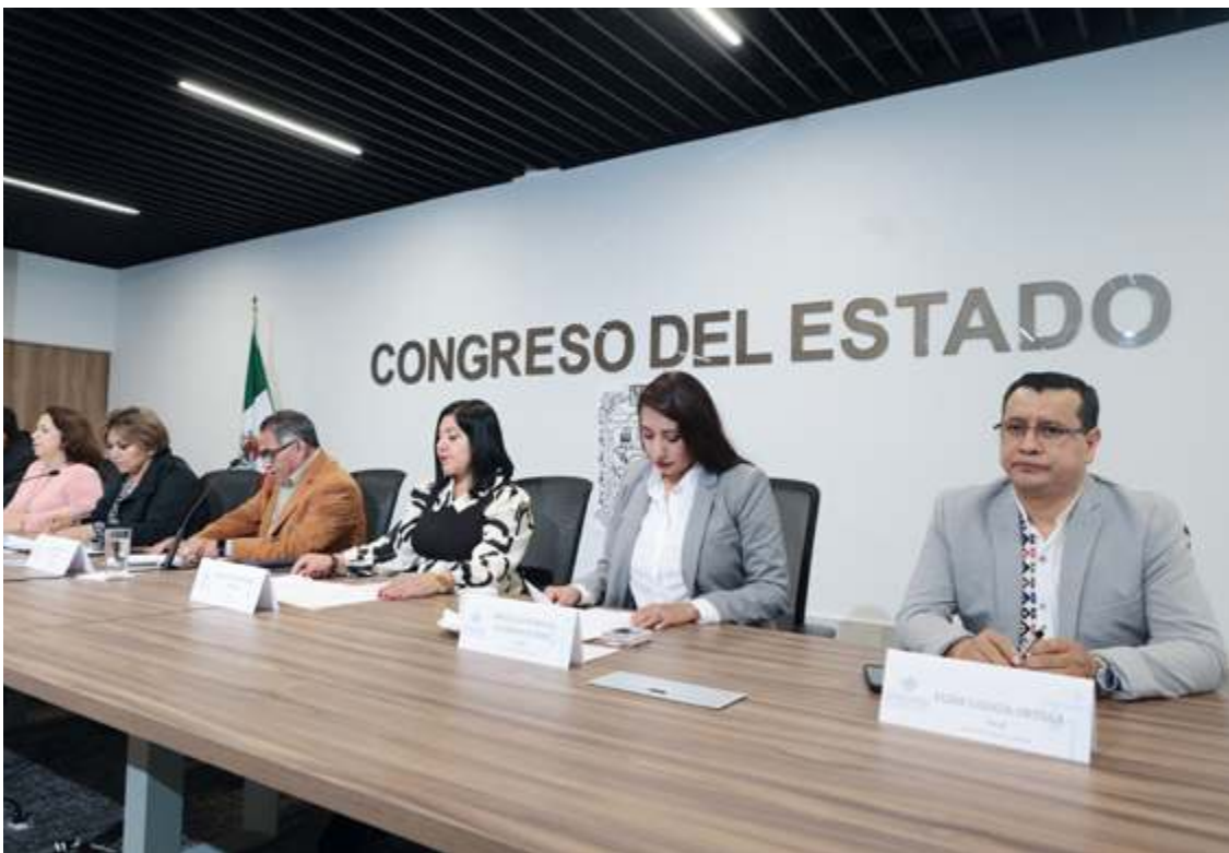
Francisco Sánchez Nolasco Fotos Cortesía

Durante la sesión de la comisión en el Congreso del estado, se indicó que se tomaron en cuenta las peticiones de los motociclistas, a quienes se les dará mayor protección sobre los vehículos de cuatro ruedas.