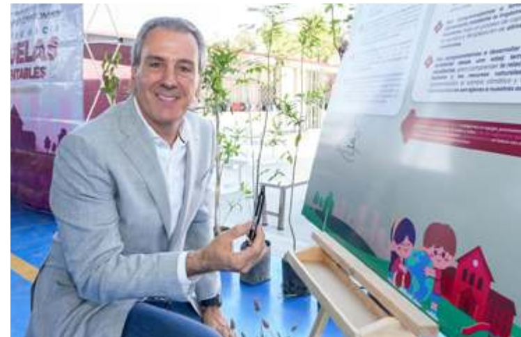
José Antonio Machado Fotos Cortesía

El Cabildo de Puebla votará este miércoles la designación del teniente coronel como nuevo titular de la Secretaría de Seguridad Ciudadana