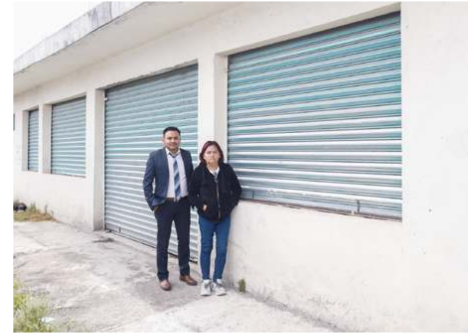
Jorge Castillo

Ubicado al norte de la ciudad de Puebla, la situación afecta tanto a comerciantes como a residentes de la zona.