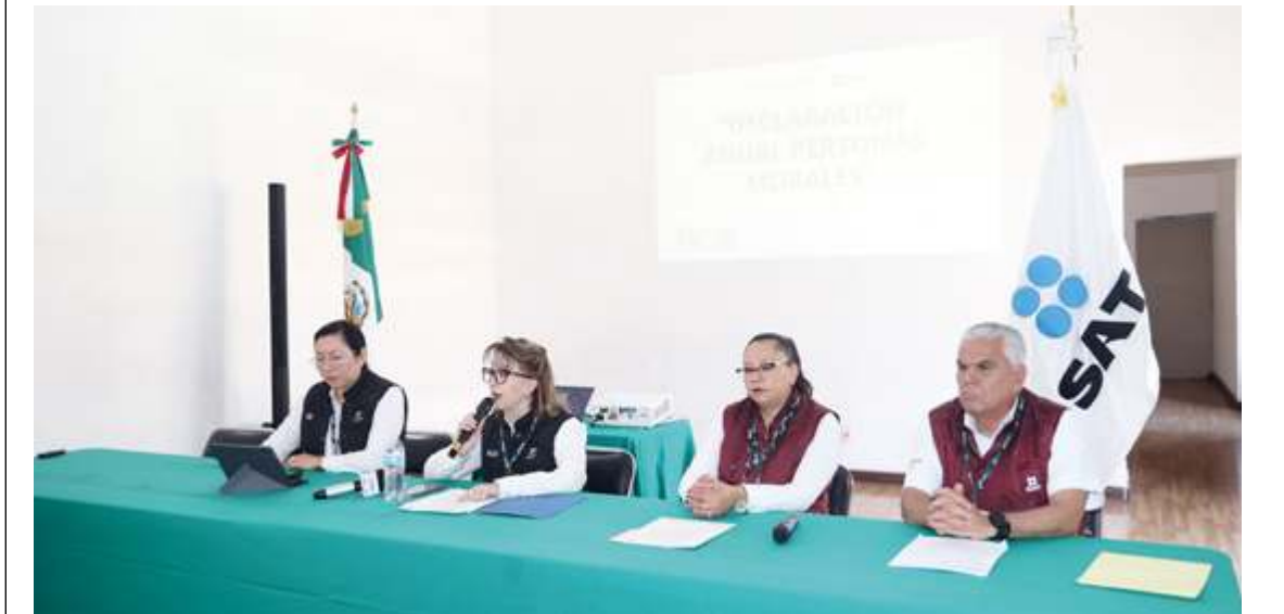
José Antonio Machado Foto Es Imagen

De no cumplir con su declaración pueden ser acreedores de una multa que va de los 12 mil a 15 mil pesos, dependiendo del régimen del contribuyente, informa el SAT.