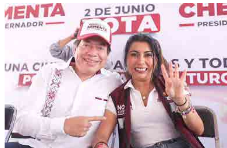
Claudia Aguilar

“A la derecha no le gustan los programas sociales”, en cambio Morena impulsó las Becas Benito Juárez, Jóvenes por el Futuro y el apoyo para los adultos mayores. “O sigue la transformación”, dijo