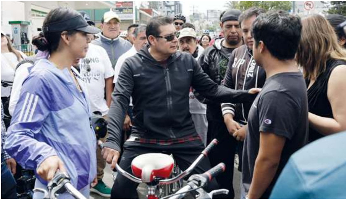
Claudia Aguilar Fotos Agencia Enfoque

El incremento al impuesto que amenaza el presidente Trump, provocará que paisanos manden más dinero a México como ocurrió durante la pandemia de Covid-19, aseguró el gobernador.