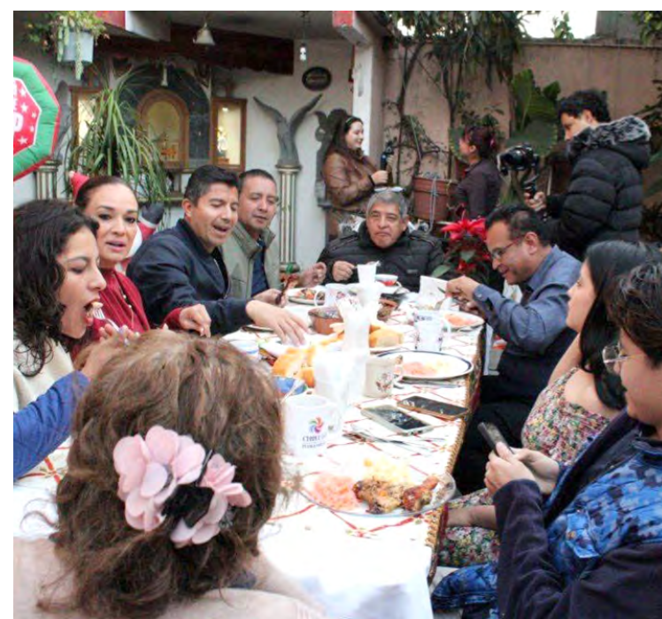
Jorge Castillo Fotos Cortesía

Con un material audiovisual y un mensaje navideño, el precandidato de la coalición Mejor Rumbo para Puebla inició sus actividades.