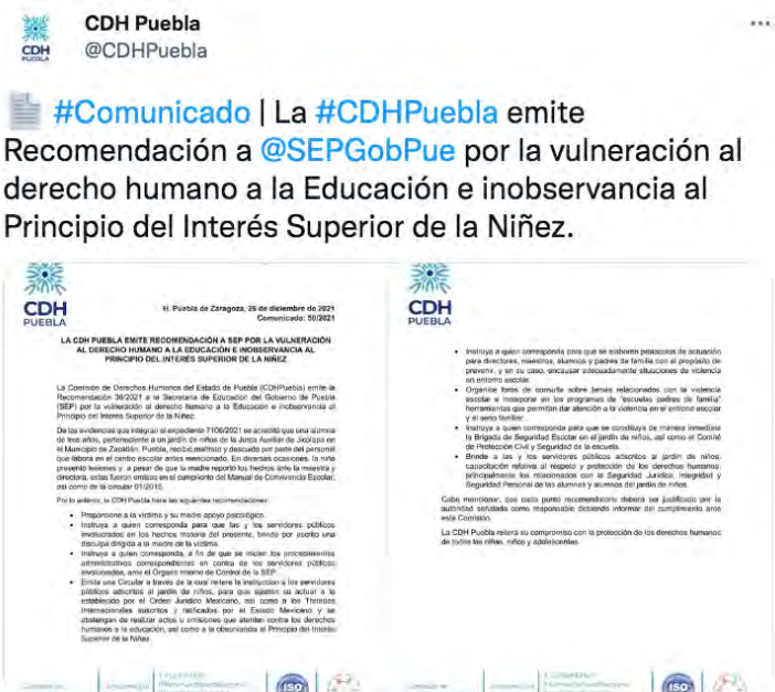
3:00 p. m. · 26 dic. 2021 · Twitter Web App