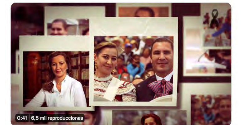
9:05 a. m. · 24 dic. 2021 · Twitter Media Studio

A 3 años de su partida, recordamos a nuestra primera gobernadora, Martha Erika Alonso, y al ex coordinador de los senadores del PAN, Rafael Moreno Valle.