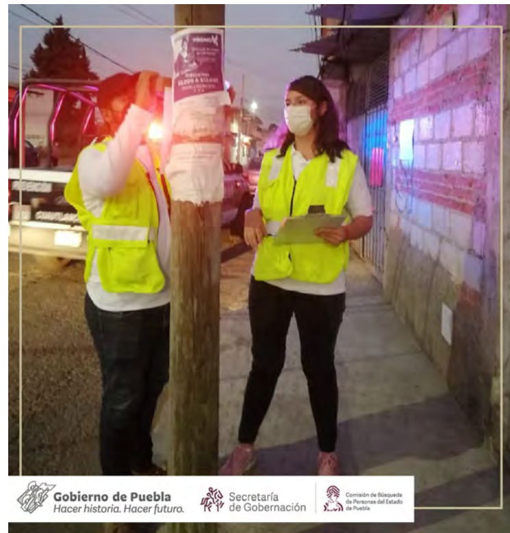
Gobierno de Puebla Hacer historia. Hacer futuro. Secretaría de Gobernación Comisión de Búsqueda de Personas del Estado de Puebla

De enero a noviembre, también se implementaron 6 mil 863 acciones de búsqueda de personas, de las cuales 5 mil 849 se relacionaron con solicitudes de in-