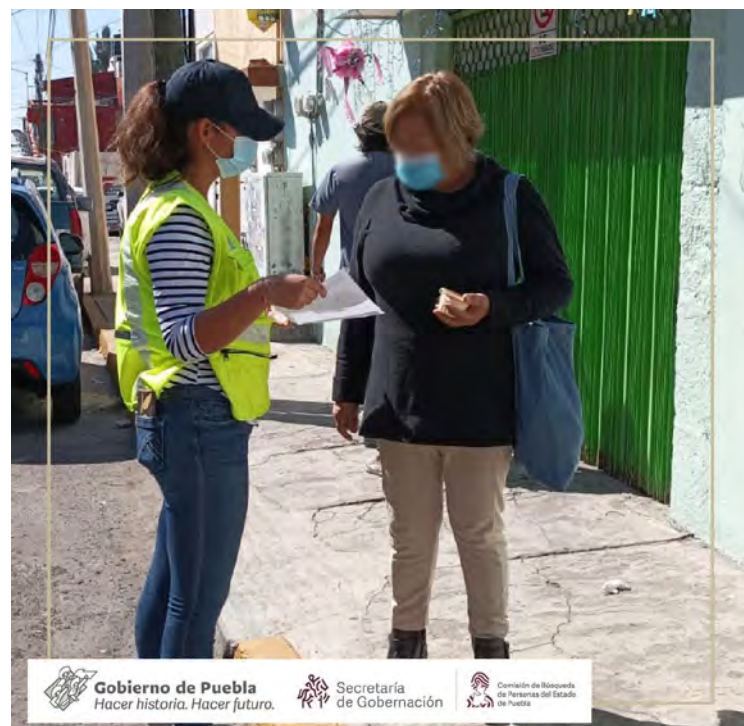
Gobierno de Puebla Hacer historia. Hacer futuro. Secretaría de Gobernación Comisión de Búsqueda de Personas del Estado de Puebla

809 personas desaparecidas 352 eran mujeres 457 hombres