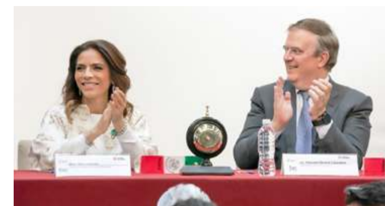
Redacción Fotos Especial

Como parte del Plan México, que lidera la presidenta Claudia Sheinbaum, con el objetivo de fortalecer la economía nacional e impulsar el valor de los productos mexicanos, la Secretaría de Economía y la Lotería Nacional celebraron el Sorteo Superior No. 2842, que lleva el sello de la campaña nacional "Hecho en México".