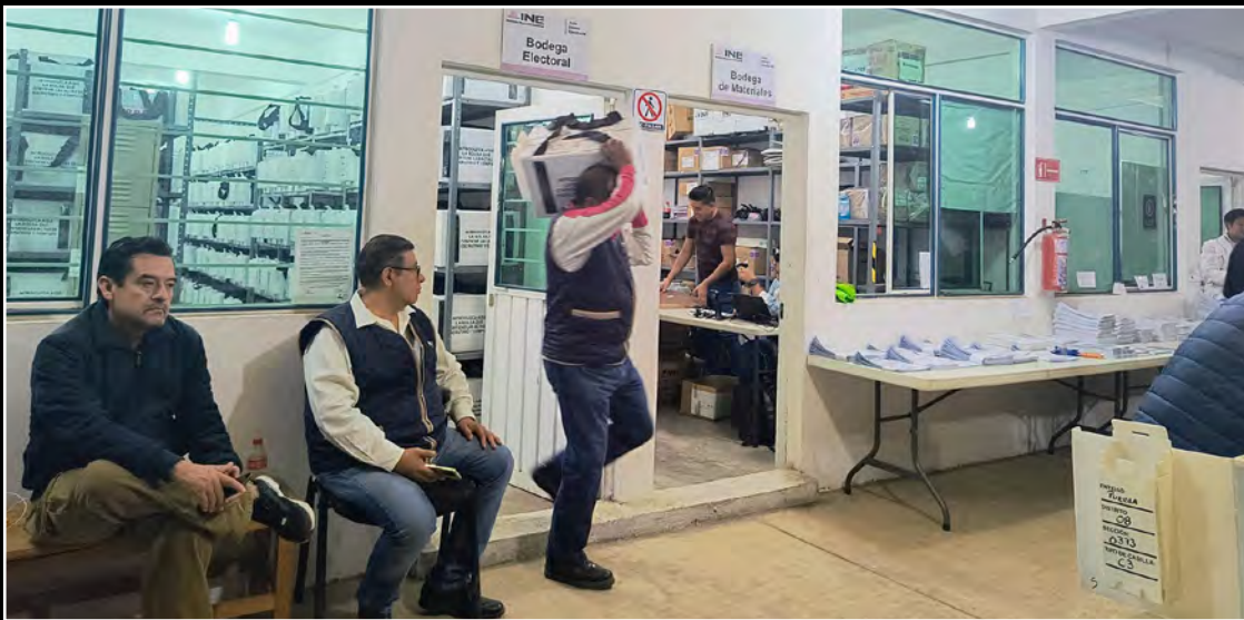
Comenzó el reparto de las boletas electorales.

Por lo anterior, solicitó al INE y al IEE se garantice la seguridad del personal encargado de la entrega de los paquetes, y aseveró que cualquier casilla que presente más boletas en las urnas de las entregadas a los lectores debería ser abierta para corroborar su autenticidad y coincidencia.