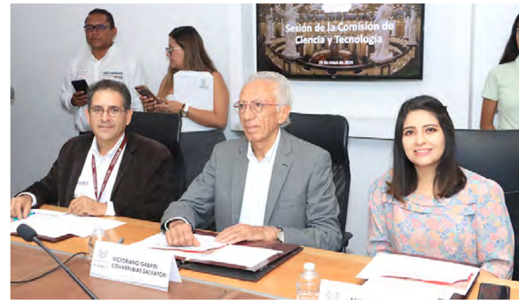
Francisco Sánchez Nolasco Fotos Cortesía

En total se inscribieron 56 personas para postularse, de las cuales 24 fueron mujeres y 32 hombres.