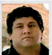
Osvaldo Arizmendi Flores