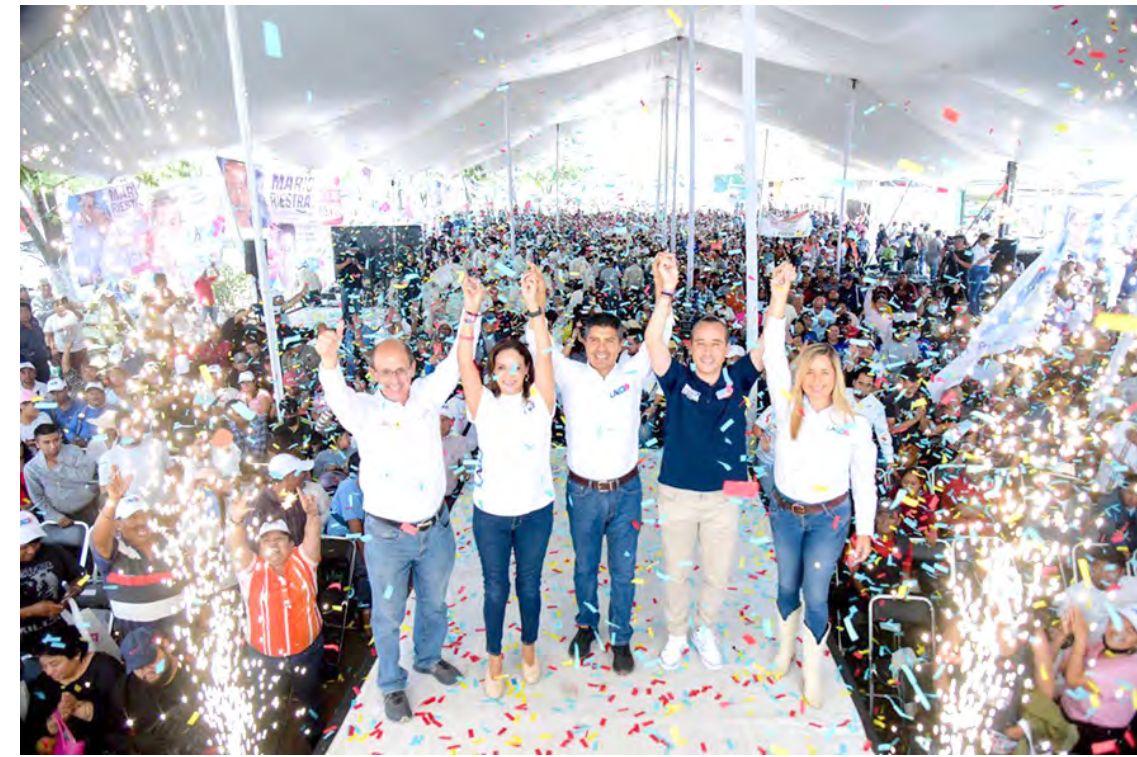
MÁS DE 2 MIL 500 PERSONAS RECIBEN A MARIO RIESTRA Y EDUARDO RIVERA